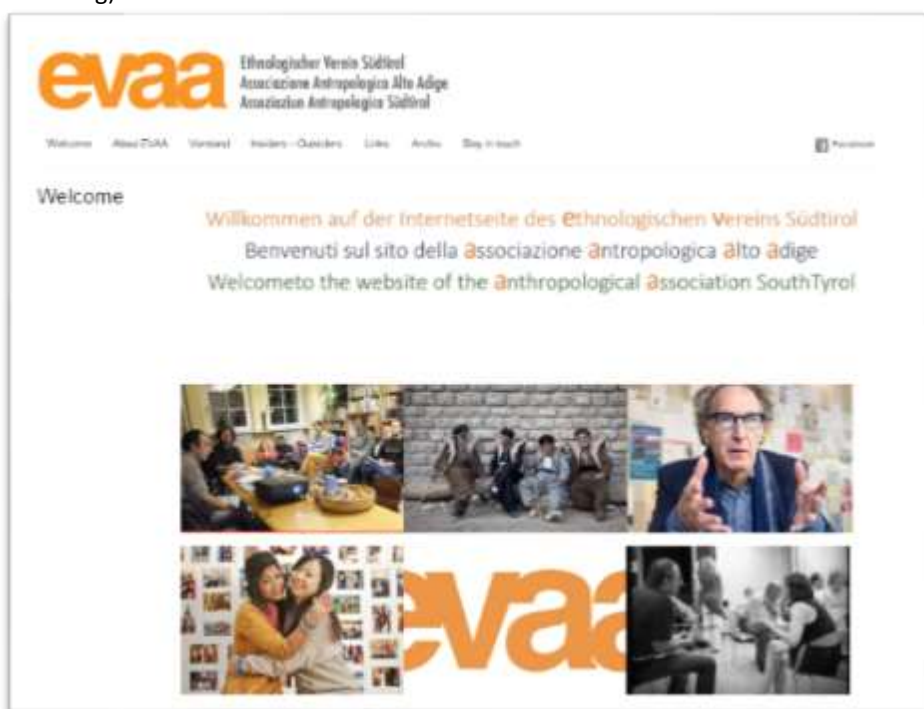
Abbildung | Immagine 7 Website des Vereins / Website di EVAA www.ev-aa.org/

Il sito www.ev-aa.org è visitabile online da marzo 2011. Esso serve da mezzo di comunicazione sia per soci che per non soci. Nel 2017 la pagina ha avuto 6.162 visitatori. Ogni visitatore rimane in media 4,5 minuti sul sito. (Fonte: one.com stats.ev-aa.org).