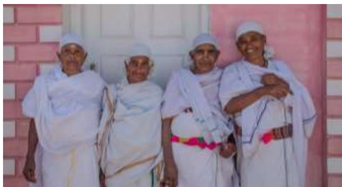
Abbildung | Immagine 4

L’intervento mirava ad illustrare le tappe fondamentali dell’antropologia visiva, una disciplina che tenta di usare le rappresentazioni fotografiche e cinematografiche per indagare l’estetica, l’invisibile e l’ethos che determina ogni società con l’intento di creare un dialogo tra culture diverse. Sono stati proiettati e analizzati documentari di repertorio, così come quelli della relatrice stessa, affinché gli studenti potessero prendere coscienza del potere che hanno le immagini di rappresentazione altrui e sviluppare un’attenzione particolare per il delicato rapporto che si instaura tra chi riprende e chi viene filmato.